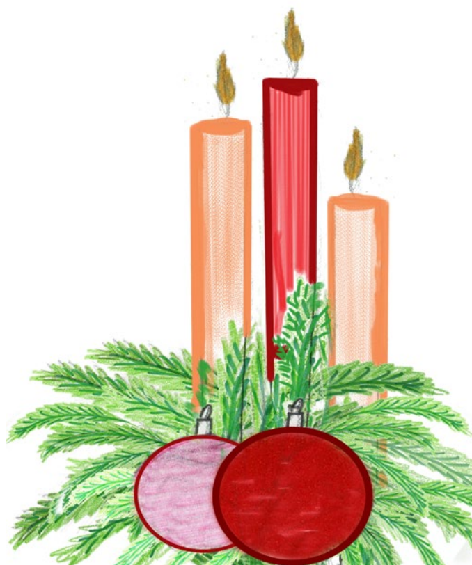
rys. Marta Olszewska

WESOŁYCH ŚWIĄT BOLDOG KARÁCSONYT BUON NATALE ハッピークリスマス VESELÉ VIANOCE FROHE WEIHNACHTEN FELIZ NAVIDAD Щасливого Різдва HYVÄÄ JOULUA کریسمس مبارک HAPPY CHRISTMAS