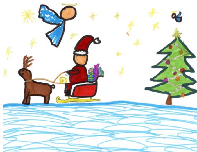
rys. grupy II i III i V internatu