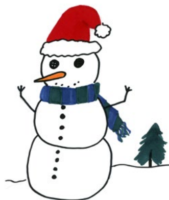
rys. grupa II internatu

ny w ciszy oglądając „Kevina”. Potem, zamiast kolęd, mających w Polsce tak długą przecież historię, z głośniczka polecą wszystkie świąteczne amerykańskie hity, mówiące o tym, że święta są super, bo możemy ubrać choinkę i dostać prezenty.